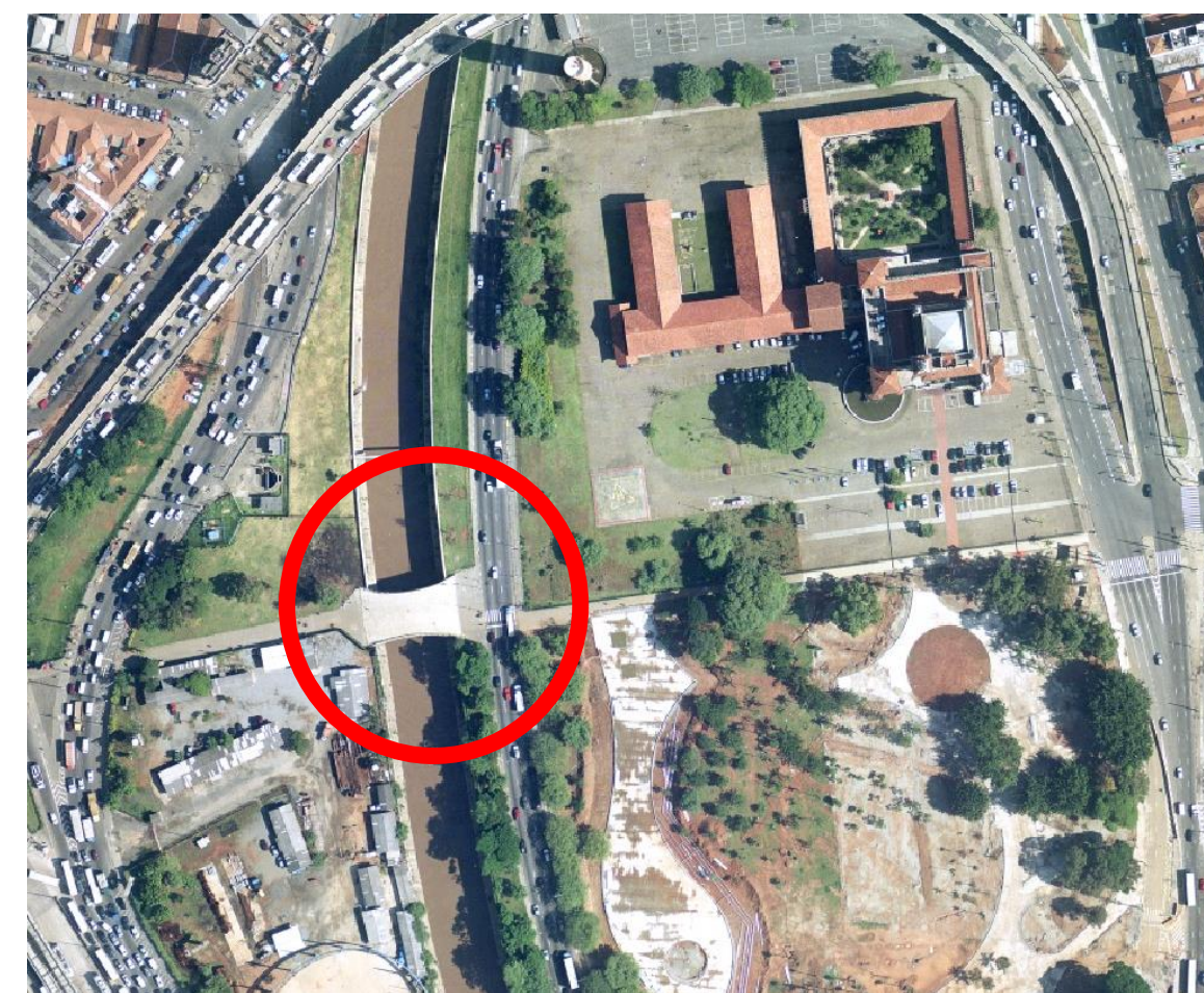
5 Passarela de pedestres no Parque Dom Pedro II