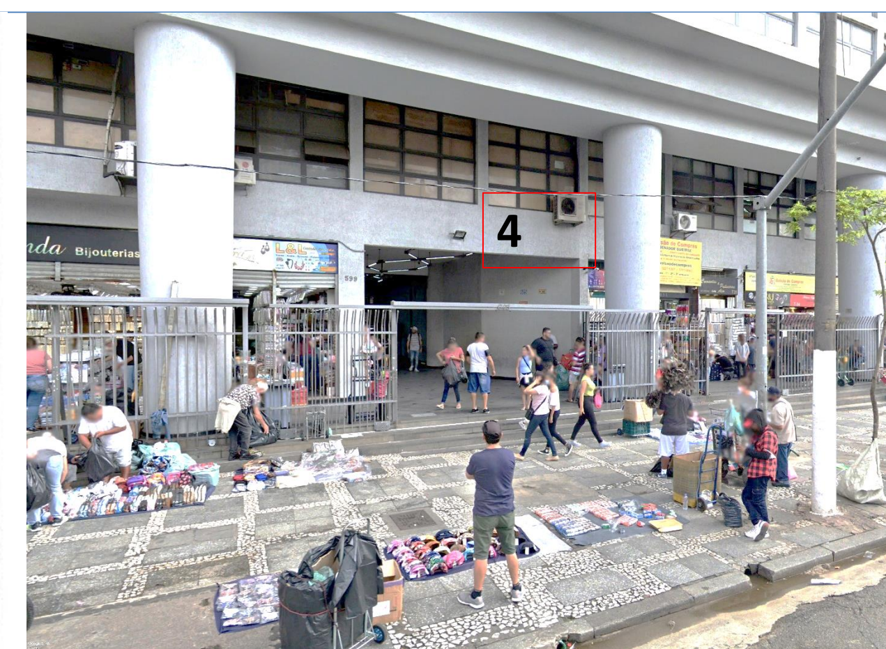
3 Caminhos pedestrianizados - Galeria do Edifício Bolsa de Cereais / o desacordo espaço x paisagem