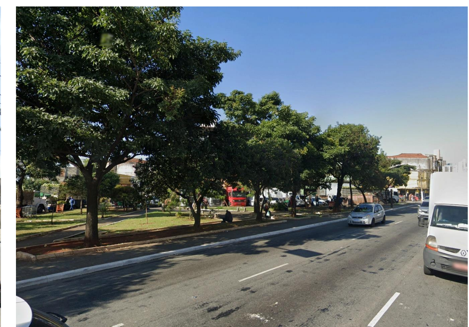
8 Largo do Pari – ponto focal para interligações Estação Cerealista (Pari) do metrô, central de abastecimento e Zona Cerealista com a margem esquerda do Rio Tamanduateí

Imagens 1 Google Earth 2 Revista Acrópole maio 1962 No. 282 5 Geosampa ortofoto MDC 3 4 6 7 8 Google Earth street view