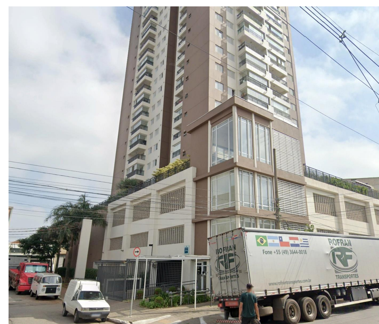
7 Condomínio Edifício Estação Brás – Rua da Alfândega 496 – possível prenúncio de um novo uso do solo na Zona Cerealista