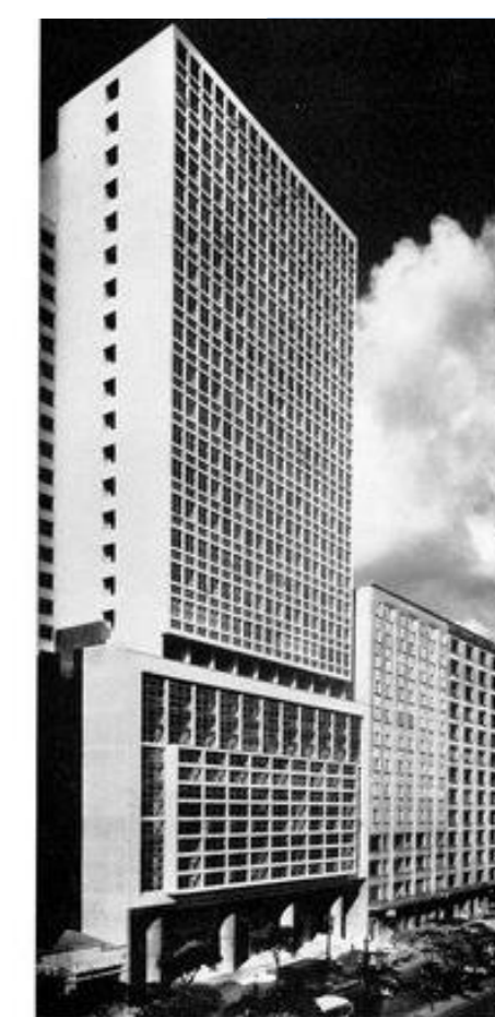
2 Edifício Bolsa de Cereais