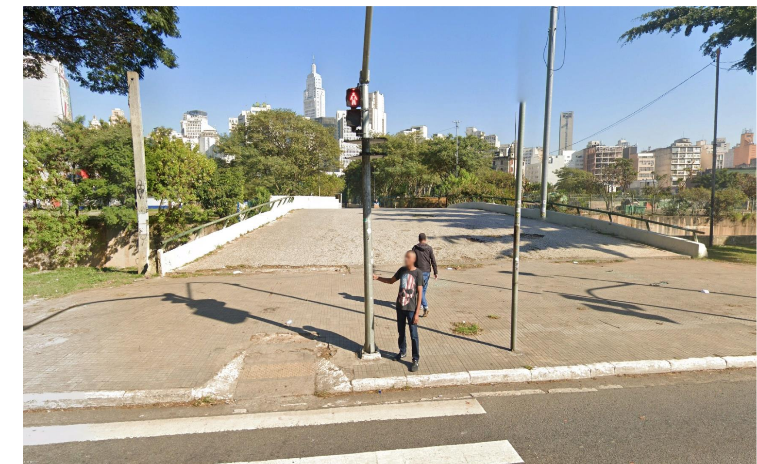
6 Passarela de pedestres no Parque Dom Pedro II – vista do "skyline"