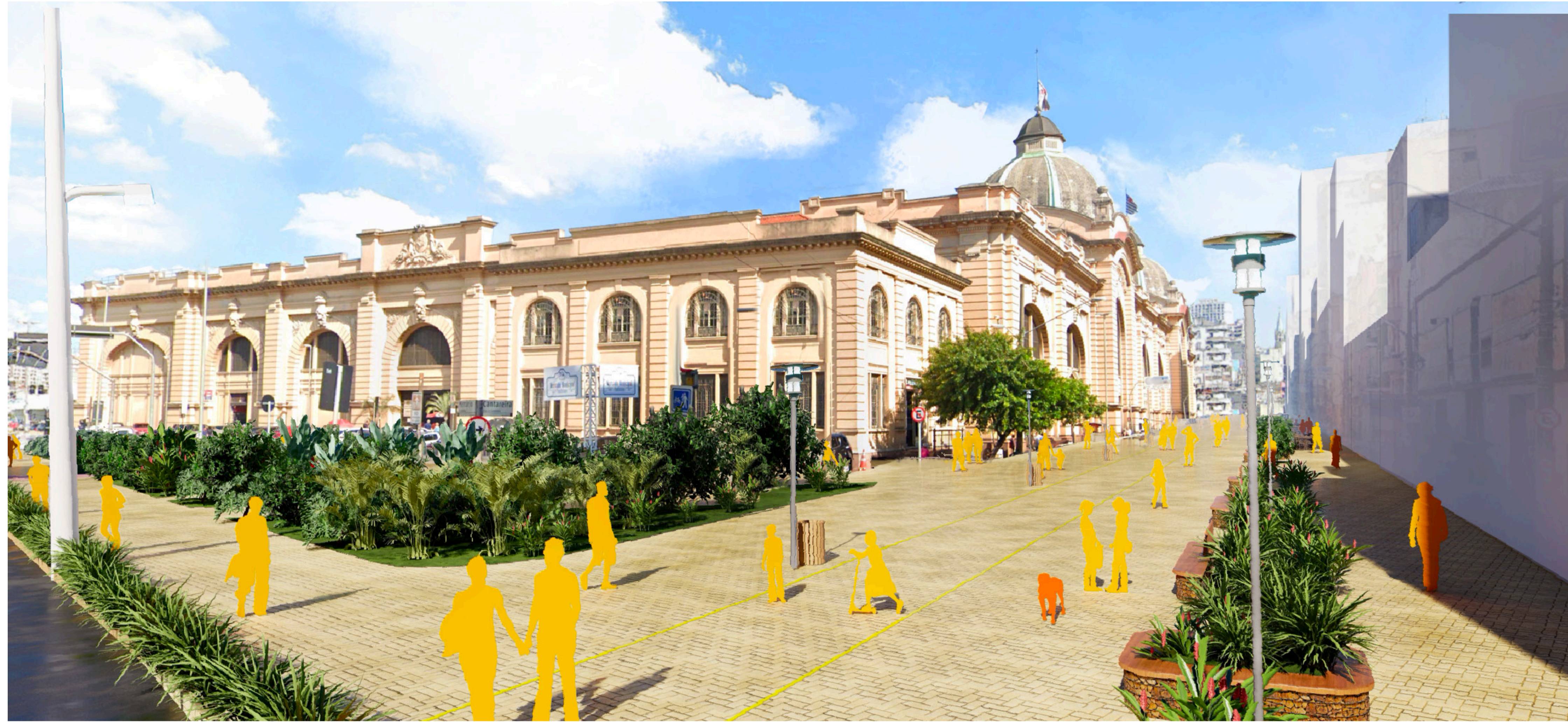
Rua da Cantareira