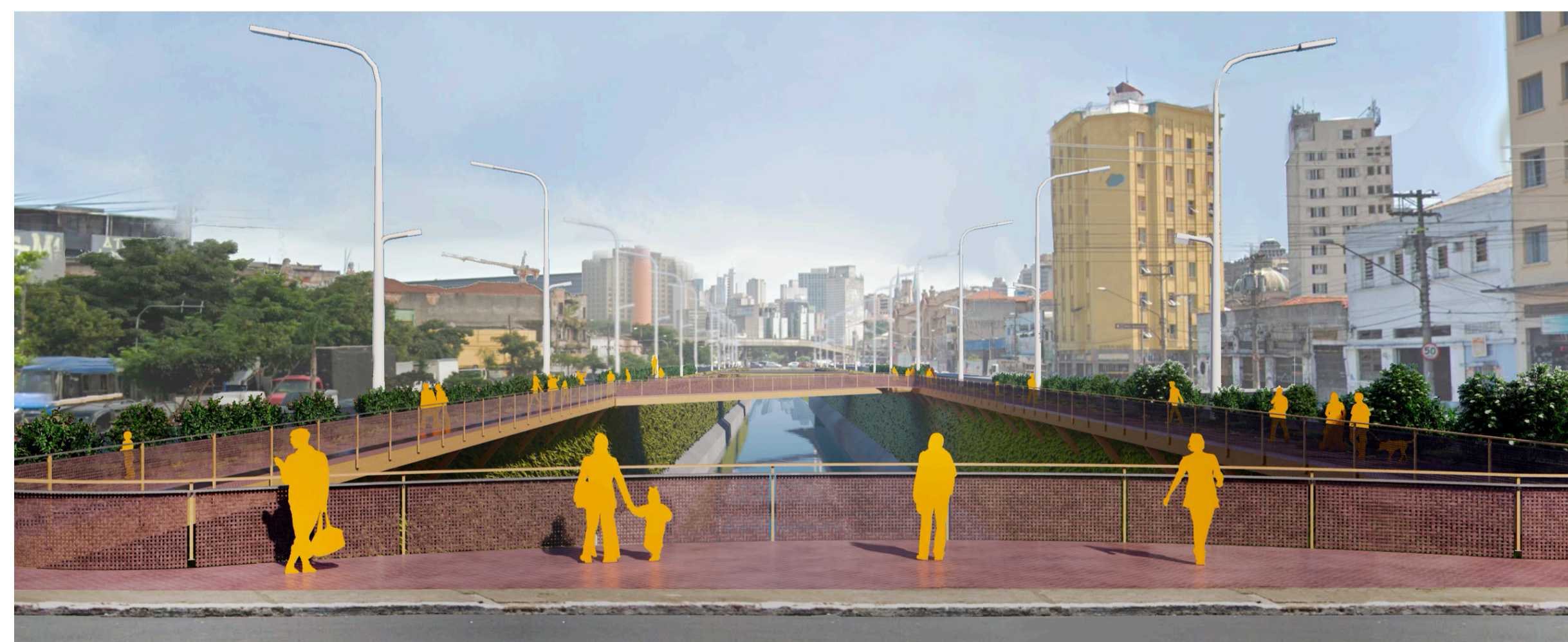
Passarelas sobre o Rio Tamanduateí, na altura da Rua Paula Souza

O projeto mantém as funções atuais de estacionamento nas laterais do Mercado Municipal e da área de carga e descarga, mas propõe seu redesenho, de forma a facilitar o acesso de pedestres ao mercado, criar canteiros com vegetação e melhorar o fluxo dos automóveis.