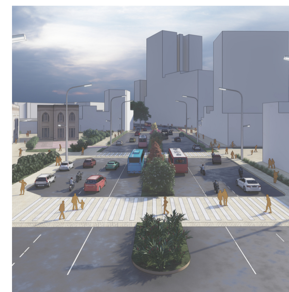
Vista da tipologia de via com iluminação e sinalizações na Avenida Senador Queirós