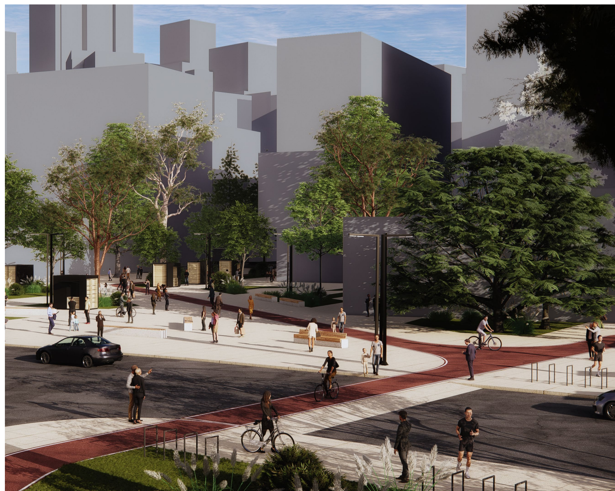
PERSPECTIVA DA RUA BARÃO DE DUPRAT REVELANDO O POTENCIAL DE CONEXÃO ENTRE AS VIAS PELOS MIÓLOS DE QUADRA