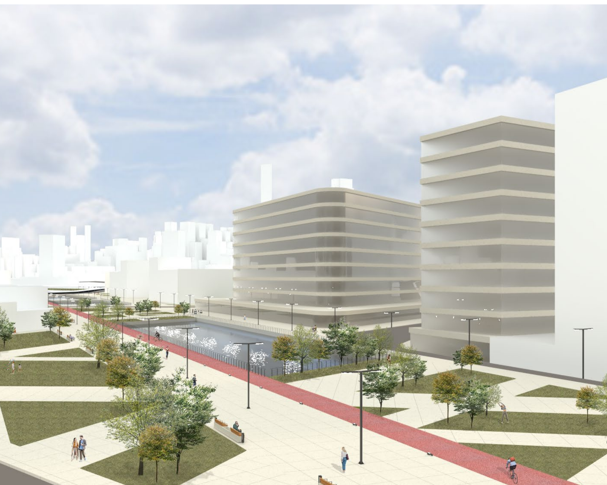
IMAGEM DA NOVA ESPLANADA MOSTRANDO RETOMADA DO ESPAÇO PÚBLICO PARA O PEDESTRE E A REVITALIZAÇÃO DA MARGEM DO RIO TAMANDUATÉ